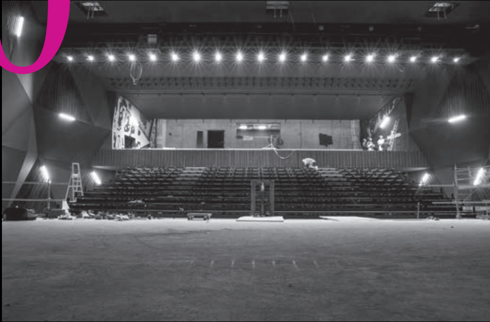
Mise en place des gradins et "pétales" de lumière créées à travers le motif de vêture sur la porte d'entrée de la salle de spectacle.