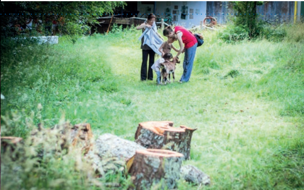
1 Spectacles des galas de danse du conservatoire du 8 au 10 juin. 2 Balade bucolique à la fête de la ferme de Saint-Niau.