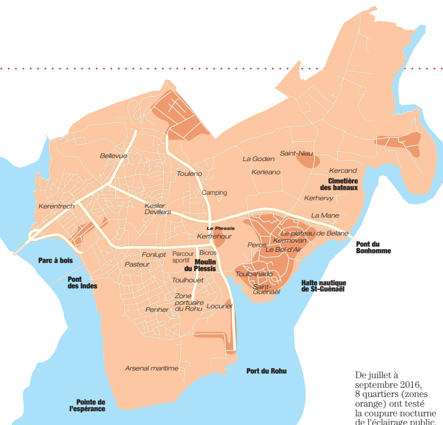
De juillet à septembre 2016, 8 quartiers (zones orange) ont testé la coupure nocturne de l'éclairage public.

inction. C'est le cas des lucioles ou encore des salamandres et des grenouilles qui réduisent leurs chasses pour éviter les prédateurs lors des nuits de pleine lune. Les animaux ne font pas la différence entre pleine lune et éclairage public. Certains oiseaux migrateurs se déplacent de nuit et s'orientent grâce aux étoiles. La lumière artificielle les attire ou les effraie modifiant leur trajectoire et provoquant des erreurs d'orientation. Chez l'être humain, l'éclairage nocturne peut perturber les cycles de sommeil, empêcher la récupération des défenses immunitaires, altérer le système hormonal qui a besoin de 5 à 6 heures d'obscurité pour bien fonctionner. L'éclairage public, un enjeu environnemental et de santé publique ?