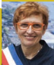
Thérèse THIÉRY maire de Lanester