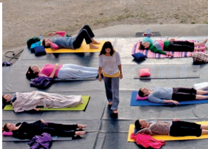
Atelier matinal de yoga, du jeudi au samedi, durant le festival de danses.

premier à lever le rideau sur sa 35 e programmation. Une trentaine de pièces, sélectionnées pour la qualité d'interprétation des comédiens, seront jouées durant les dix jours du festival. La formule déjà bien rodée propose deux journées thématiques, l'une consacrée aux jeunes des ateliers de pratique théâtrale, l'autre aux matchs d'improvisation. Cette année, une balade contée sera proposée sur le sentier de randonnée et un jury jeune sélectionnera des spectacles. Expositions, stages, guinguette musicale, tout est prévu pour passer un agréable moment. "Quai 9 à Kerhervy" est le premier rendez-vous culturel de la programmation hors les murs de Quai 9. Cette année, la programmation privilégie le théâtre professionnel et propose trois pièces sorties du répertoire classique. Elles seront jouées chacune deux soirs à partir de 21h30. La guinguette ouvrira ses portes à 19h pour une première partie de soirée en musique.