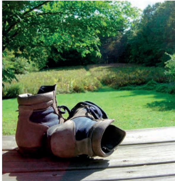
10 km et deux haltes gourmandes : miam!

Tarifs adultes : 12 euros, moins de 12 ans : 5 euros Inscriptions au 06-82-04-42-92 ou 06-12-75-09-77 ou www.lesenfantsduplessis.com (bulletin d'inscription à télécharger).